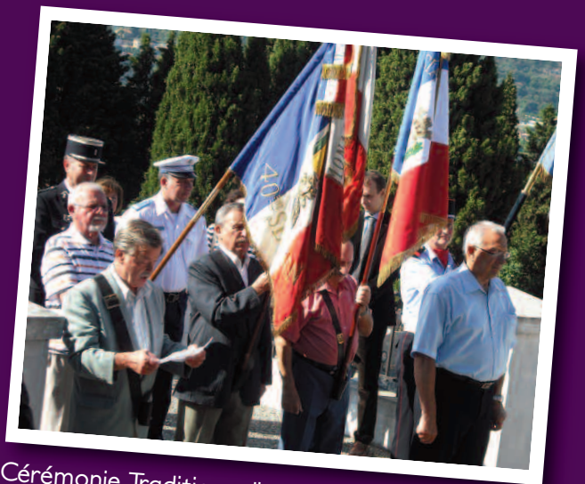
Cérémonie Traditionnelle de la lecture de l'Appel Historique du Général de Gaulle le 18 juin

Une partie de la joyeuse équipe de l'APE présente lors du vide-greniers de Cap d'Ail. Les bénéfices de la vente des jouets collectés iront directement aux écoles