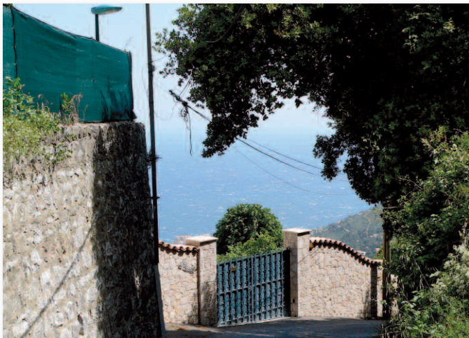
▲ A la Scoperta, le panorama sera bientôt dégagé des poteaux et fils téléphoniques

Et même, un petit abri a été aménagé par l'équipe technique municipale pour... la nourriture qu'une dame turbiasque apporte chaque jour aux chats du quartier !