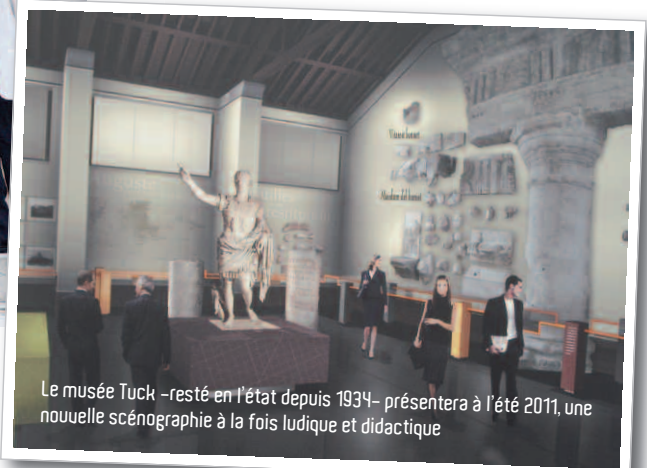
Le musée Tuck –resté en l'état depuis 1934– présentera à l'été 2011, une nouvelle scénographie à la fois ludique et didactique