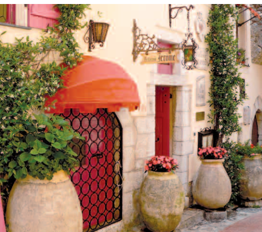
et l'hostellerie Jérôme (5 chambres haut de gamme). Après avoir envisagé la création d'une structure hôtelière dans le quartier à

Et puis nous avons élaboré une visite guidée audio de La Turbie qui va être mise en place courant juillet et proposée gratuitement à chaque visiteur. Ce projet est mené avec la CARF (2) , qui nous fait bénéficier d'une technologie de pointe et... de financements extérieurs !