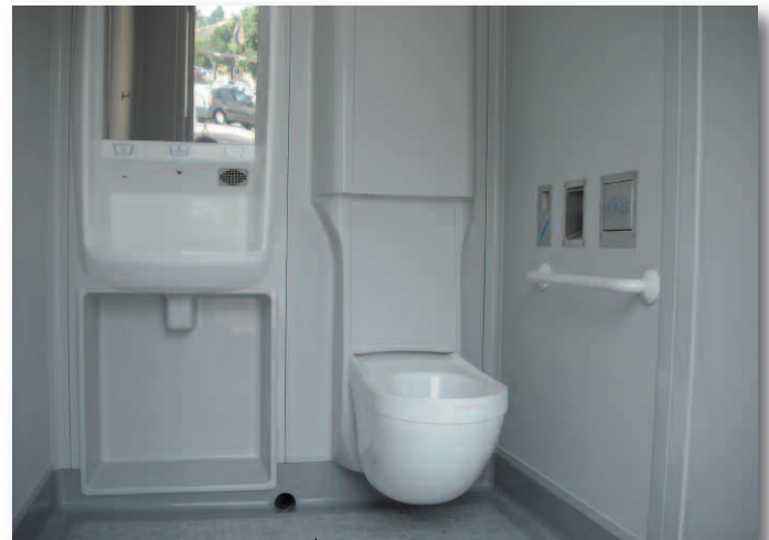
▲ Les nouveaux WC sont accessibles aux personnes handicapées.