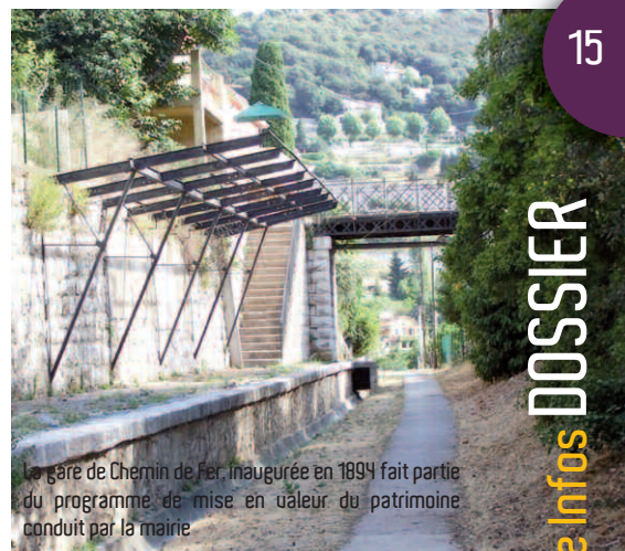
La gare de Chemin de Fer, inaugurée en 1894 fait partie du programme de mise en valeur du patrimoine conduit par la mairie