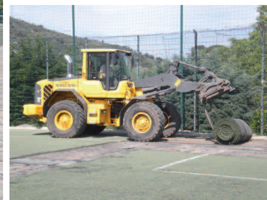
Le stade a été entièrement « déshabillé » de son ancien revêtement pour les travaux préparatoires à la mise en place de la nouvelle pelouse synthétique