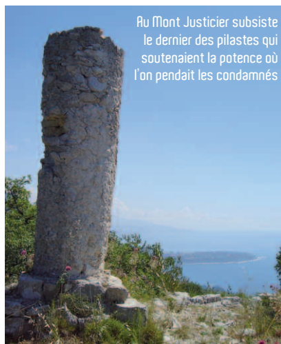
Au Mont Justicier subsiste le dernier des pilastres qui soutenaient la potence où l'on pendait les condamnés

1 - Coût total du projet CHEMIN de la CARF : 315 000 €, répartis entre l'Université de Nice (215 000 €) et la CARF (100 000 €). Ces dépenses étant subventionnées par l'Europe et de la Région à hauteur de 80%, le coût réel pour la CARF est limité à 20 000 €.