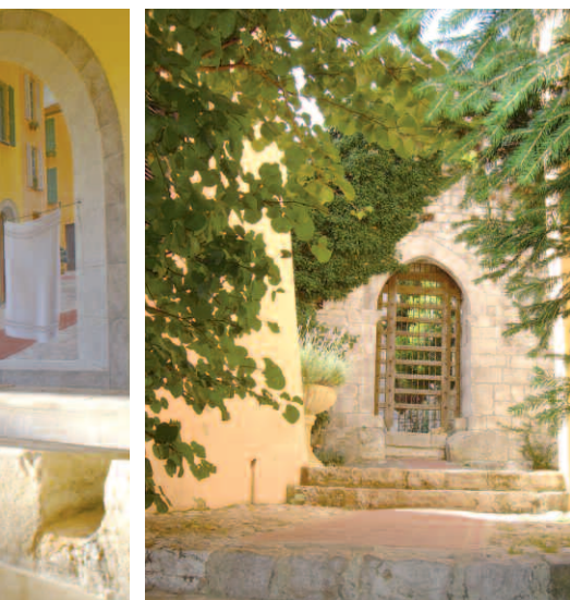
Au détour d'une ruelle fleurie du village médiéval, apparaît, majestueux, l'ancien portail du réduit