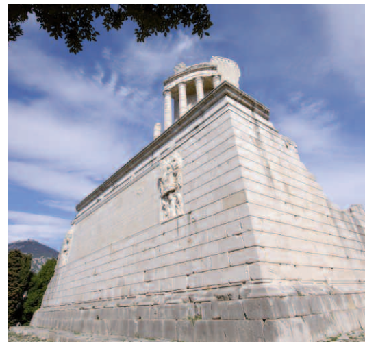
Le Trophée –dédié à l'Empereur Auguste– domine fièrement la Méditerranée depuis plus de 2000 ans