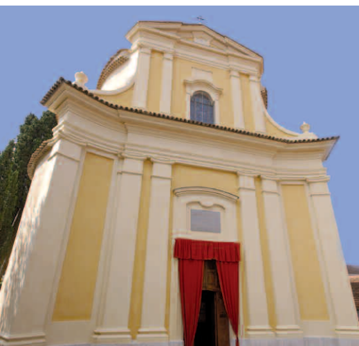
L'église Saint-Michel -rénovée cette année- a été bâtie à partir des pierres du Trophée en ruines