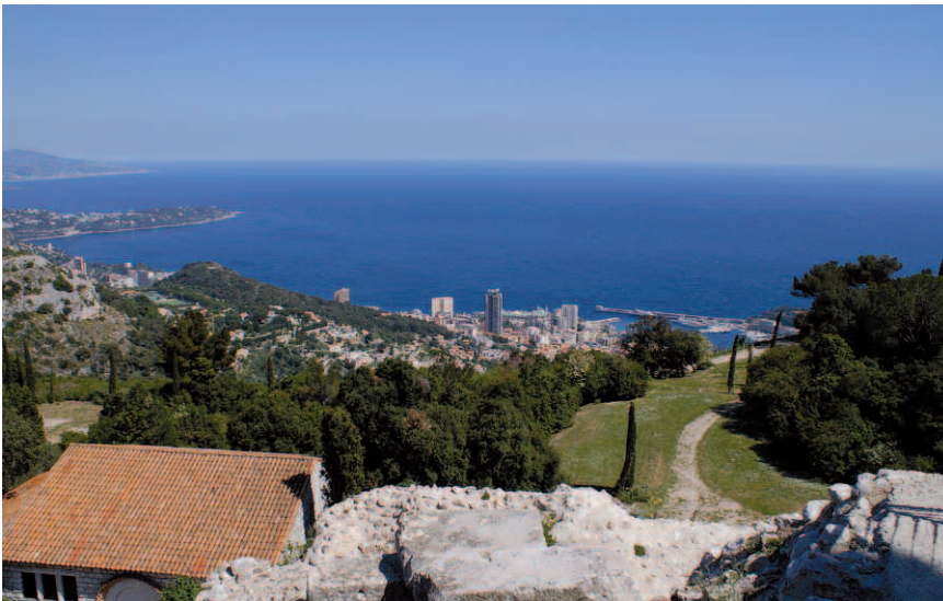
Partout où le regard porte, depuis la Tête de Chien jusqu'au Mont Bataille, La Turbie offre des panoramas époustoufflants, parmi les plus beaux de la Côte d'Azur