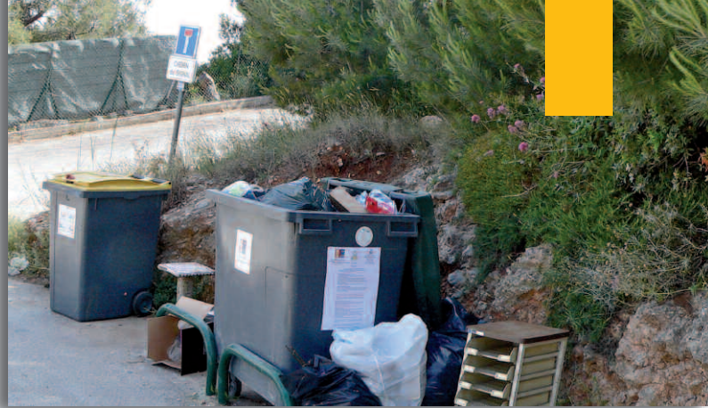
▲ Dans certains quartiers, le spectacle des poubelles qui débordent et des encombrants abandonnés est triste à voir

« Cela ne doit pas être une incitation à produire plus de volume de déchets ! Nous demandons à chacun de faire un effort, au contraire, pour le limiter : préférer des produits sans emballage, trier ses déchets, les compacter au maximum et faire appel au compostage... »