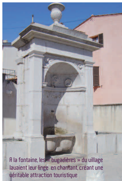
À la fontaine, les « bugadières » du village lavaient leur linge en chantant, créant une véritable attraction touristique

Et puis la CARF est arrivée avec son projet CHEMIN : équiper gratuitement, dans chaque commune de son territoire, 5 sites ou monuments de Tags (puces électroniques) permettant au visiteur, via son téléphone portable, de récupérer de l'information concernant ce site (audio, vidéo et photos) et même de déposer à son tour ses commentaires.