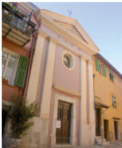
La chapelle Saint-Jean a abrité la confrérie locale des Pénitents blancs dite « du gonfalon »