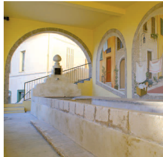
Le lavoir du Moulin est l'un des trésors patrimoniaux du village. Dans son écrin voûté, il offre un moment de fraîcheur aux visiteurs qui le découvrent