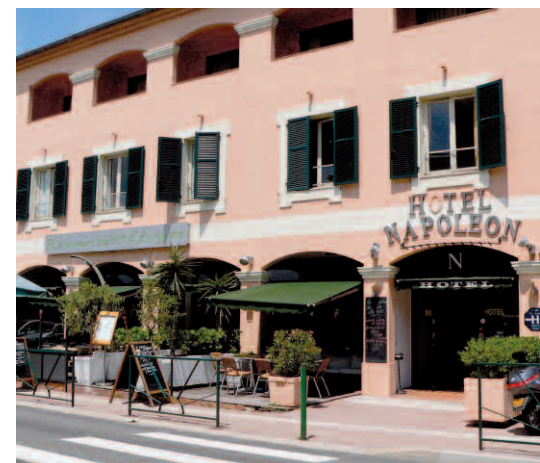
Il ne reste que deux hôtels à La Turbie : le Napoléon** (24 chambres) sauvé de sa transformation en grande surface, la commune aménagée à la Tête de Chien.

« Nous devons désormais faire la promotion de notre village »