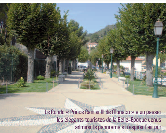
Le Rondo « Prince Rainier III de Monaco » a vu passer les élégants touristes de la Belle-Époque venus admirer le panorama et respirer l'air pur

Par ordre d'apparition dans l'Histoire : le Trophée d'Auguste ; la chapelle Saint Roch et la carrière romaine du Mont Justicier (site classé) : son beau calcaire blanc, la colombine de La Turbie, très résistante, blanchit sous la pluie ; la place Saint Jean Baptiste avec sa chapelle et le portail Gioffredo –marbre arraché à la façade du trophée d'Auguste ; l'église Saint-Michel (édifiée entre 1764 et 1777) ; la Fontaine Carolo Felcerege, en calcaire de La Turbie (1824) dédiée au roi sarde Charles Felix (monument historique) ; le Rondo, balcon en pierre de tailles du XIX ème siècle ; et les vestiges de la gare de l'ancien chemin de fer à crémaillère entre Monaco et La Turbie.